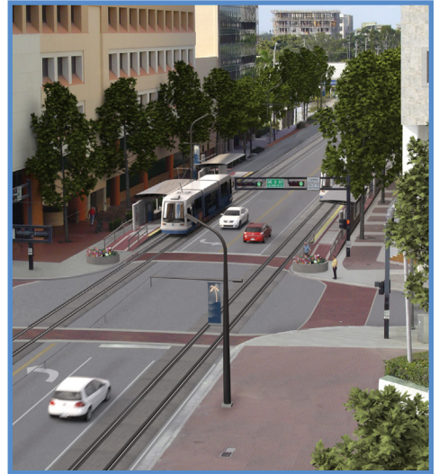
Ale sou sit entènèt "Wave" la pou jwenn plis enfòmasyon nan www.wavestreetcar.com .

Yo te soumèt aplikasyon pou sibvansyon an avèk apui ajans patnè yo, tankou pa egzanp, Depatman Transpòtasyon Florida (Florida Department of Transportation), Vil Fort Lauderdale, Enstans pou Devlopman Santrevil (Downtown Development Authority), Broward MPO ak Enstans Rejyonal pou Transpòtasyon nan Sid Florida (Florida Regional Transportation Authority). Yo prevwa ke fon pou sibvansyon sa yo pral disponib pou kòmanse travay pwojè a nan komansman 2011.