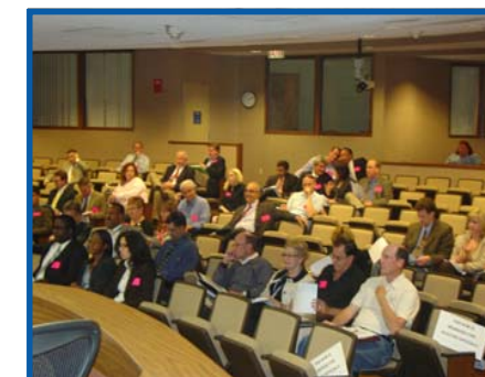
Gen anpil ajans transpò, ansanm ak moun nan piblik la, ki te vini nan reyinyon somè pou Finansman Transpò Rejyonal 2008 SEFTC la.

Yo te fonde SEFTC a pou l sèvi tankou yon fowòm fòmèl pou kowòdone politik yo ak pou ede nan kominikasyon, pou yo te ka rive egzekite inisyativ rejyonal MPO nan konte Broward, Miami-Dade, ak Palm Beach yo te deside pou yo fè. Pou plis enfòmasyon sou SEFTC a, ou mèt ale nan sit entènèt http://www.miamidade.gov/mpo/seftc/home.htm .