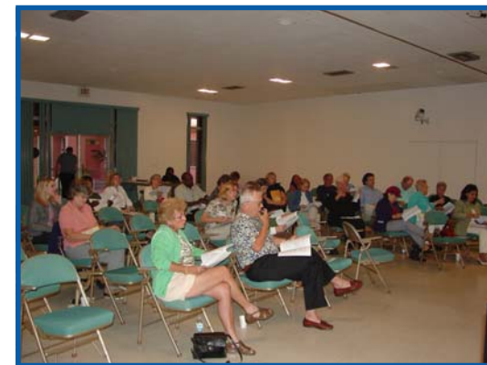
Nan pami moun ki te vini nan atelye Scenic Highway A1A a, te gen moun ki soti nan plis pase 15 minisipalite nan Broward County.