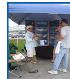
Moun nan piblik la te jwenn yon tan, pandan Garden Fest 2008 la, pou yo te pale ak anplwaye MPO Broward yo sou kesyon transpò ki te enpòtan pou yo.