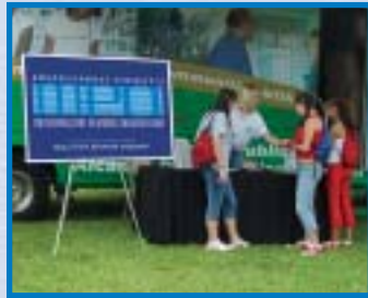
Festival Anual de la Tribu Seminole

En medio de la artesanía superior que presentan las joyas en plata fina y las obras de arte de los Indígenas Norteamericanos, la Organización de Planificación Metropolitana (MPO) del Condado de Broward habló sobre asuntos relacionados con el transporte y sobre el impacto que la planificación del transporte tiene sobre los habitantes de la comunidad de Davie.