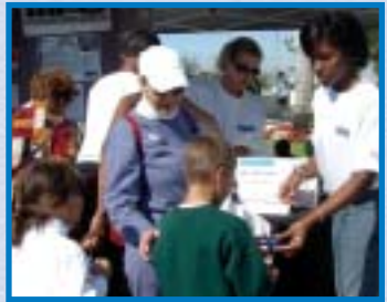
Kids Konection, Pembroke Pines

¿Qué podría ser mejor que dar un paseo por el parque un sábado por la mañana para un niño de la escuela primaria? Ir a uno de los más grandes eventos para niños en el Condado de Broward, ¡eso es!